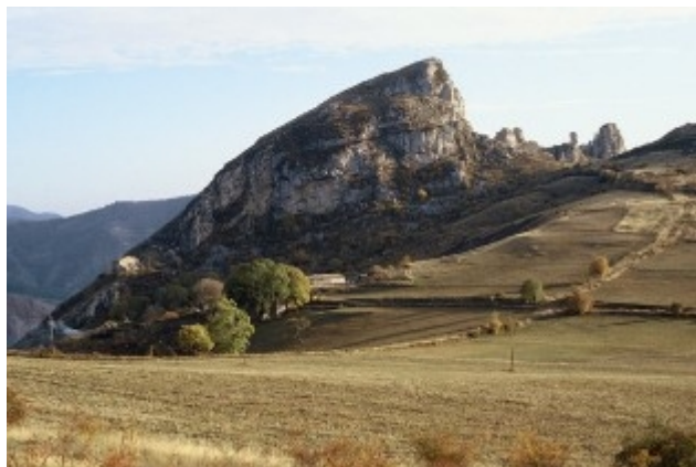
Rocher du dromon Saint- Geniez