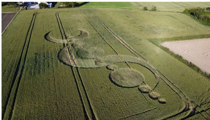
Le même vu sous un autre angle

Beaucoup de gens élaborent des théories en ce qui les concerne.