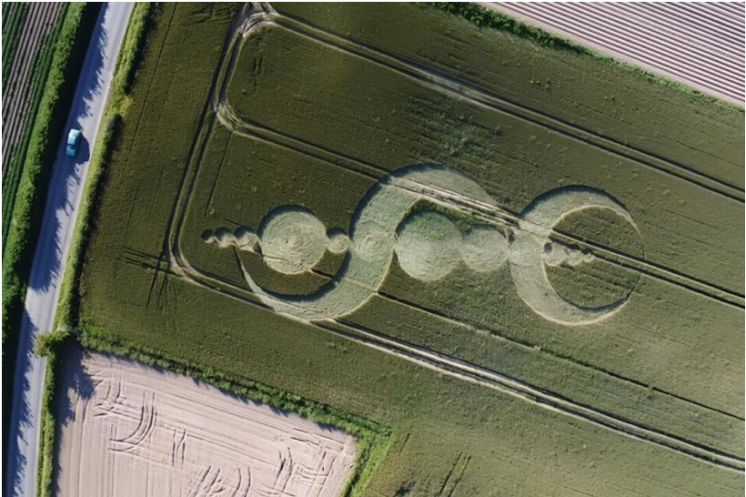
Crop-circle apparu le 10 Juin 2024 en Bretagne

Très nombreux à travers le monde, ils ne sont apparus en France qu'il y a une dizaine d'années.